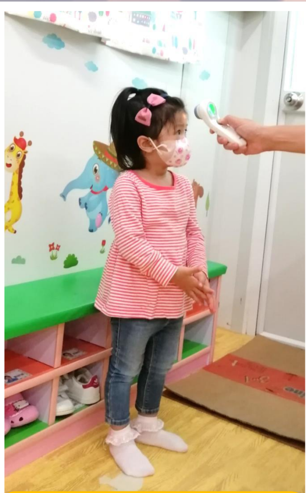
上課前後幼兒 量度體溫