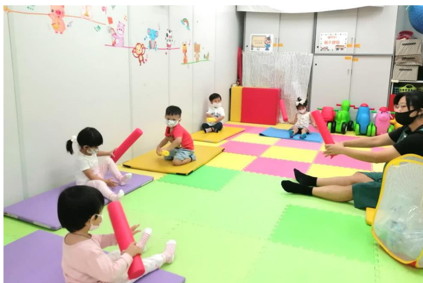
活動期間幼兒會保持適當的社交距離