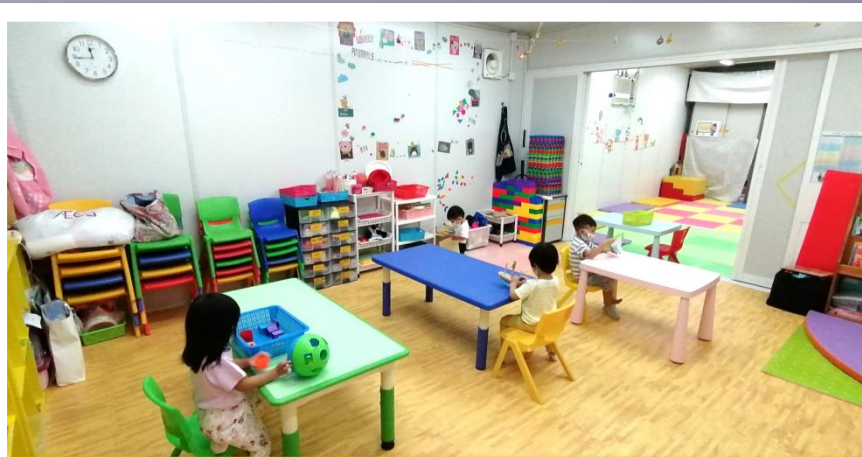
自由活動時間時，幼兒間會保持適當的社交距離