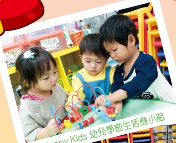
Happy Kids 幼兒學前生活應小組