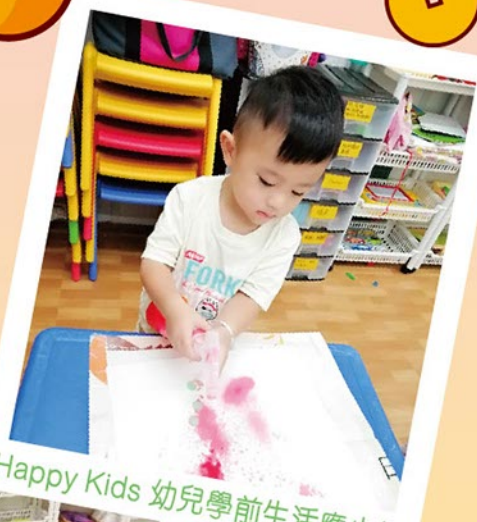
Happy Kids 幼兒學前生活應小組