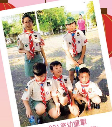
281旅幼童軍 戶外實習 (追蹤符號)