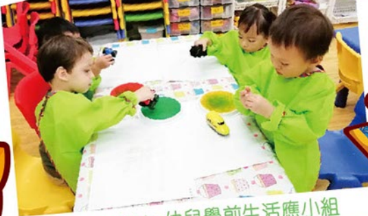
Happy Kids 幼兒學前生活應小組