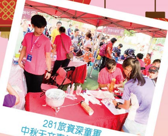
281旅資深童軍 中秋天文嘉年華 義工服務