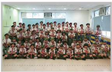
新成員加入@童軍宣誓禮