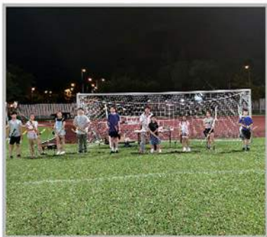
青少年箭藝訓練班