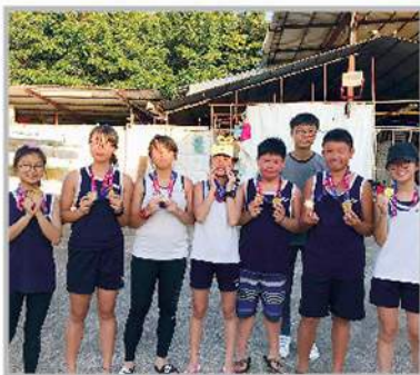
全港公開獨木舟短途及 分齡賽2018 輔金