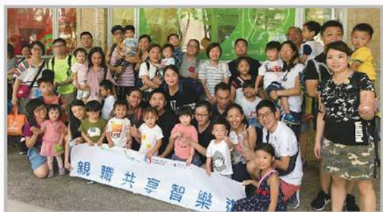
幼兒服務「親職共學智樂遊」