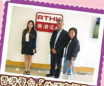
香港電台「生活有關愛」 長者服務訪問