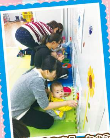
親子班-幼兒與家長一起做印畫