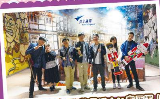
RAND組-GEAR (TEEN藝展活力比壽亞軍!)