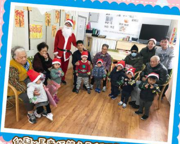
幼兒x長者托管之聖誕聯歡會