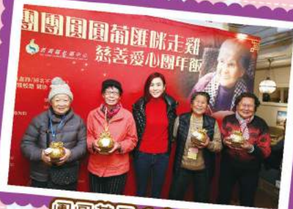
團圓葡國味走雞 - 耆友記同宣管食團年飯