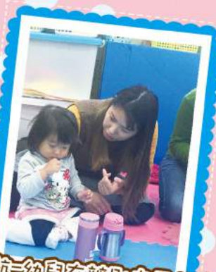
樂啟航-幼兒在辨別自己的物品