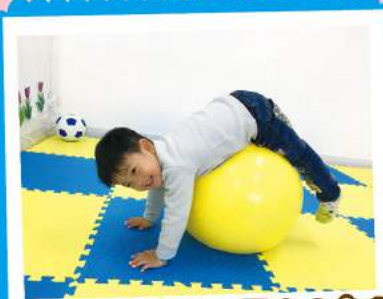
學前班-看！我的平衡力多好