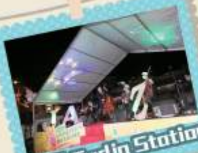
樂團 Godjo Station