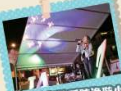
著名歌手陳逸璇小姐與樂隊Wonder Hour