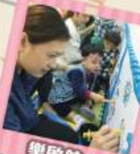
樂啟航 幼兒發展訓練小組