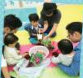
嬰幼兒潛能啟蒙親子班