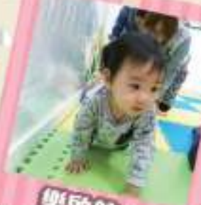
樂啟航 幼兒發展訓練小組