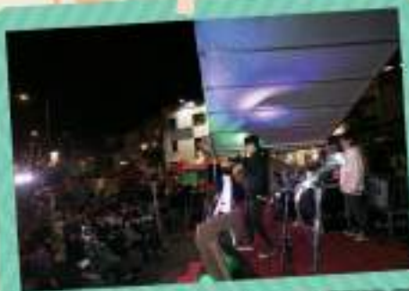
Beatbox藝人 R.X. 黃浩邦