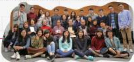
故事冊製作十分認真，參與長者都要求「加印」■