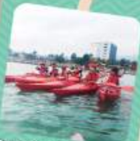
獨木舟旅程-威士紀灣